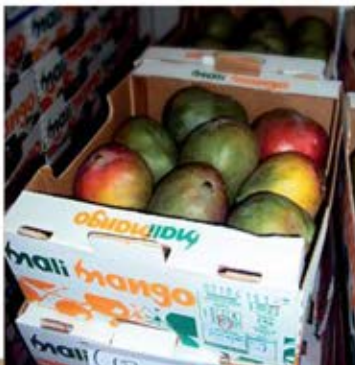
▲ La chaîne de conditionnement de SCS à Sikasso