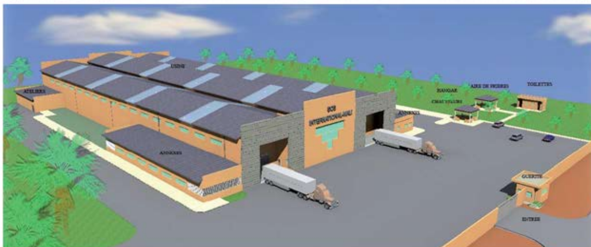
Vue de l'usine (en 2016)

La société SCS, comme les autres entreprises nationales, est depuis l'origine confrontée à un problème d'approvisionnement d'emballages (absence d'usine au Mali).